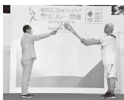
聖火リレーの点火式

昨年に続き、新型コロナウイルス対策を幅広く推し進めた令和3年。泉外旭川誕生、文化創造館オープン、東京2020オリンピック開催など、明るい話題も織り交ぜながら、映像でこの一年を振り返ります。ぜひご覧ください！