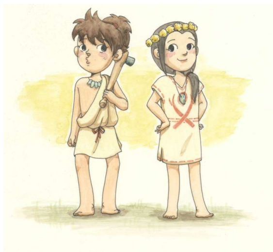
弥太郎くん 弥生ちゃん (地蔵田遺跡弥生っこ村マスコットキャラクター)

秋田市文化振興ビジョン 令和3年度事業計画 令和3年6月発行 編集・発行 秋田市観光文化スポーツ部文化振興課 〒010-8560 秋田市山王一丁目1番1号 電話 018-888-5607 FAX 018-888-5608