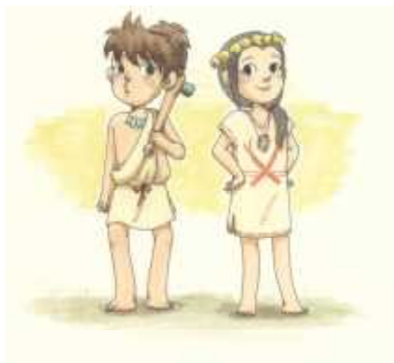
弥太郎くん 弥生ちゃん (地蔵田遺跡弥生っこ村マスコットキャラクター)