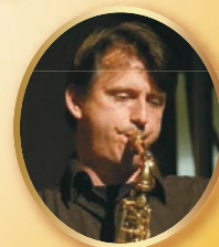
グレゴール・ベルグ （サクソフォン）