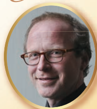
シュテファン・バイアー （パイプオルガン）