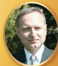
マティアス・エドナー・フォン・ブロック （トランペット）