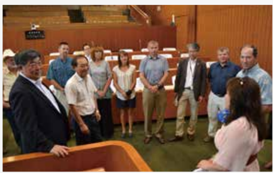
市議会の議場を見学