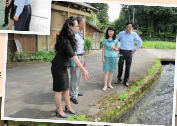
鵜養集落で 用水路の視察