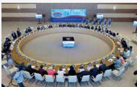
姉妹都市国際会議

ウラジオストク市政府の招へいを受け、本市職員2名がウラジオストク市建都155年記念式典および姉妹都市国際会議に出席しました。ウラジオストク市と姉妹都市提携をしている自治体に参加した姉妹都市国際会議では、本市の成長戦略の一つである『「ブランドあきた」の確立』をテーマに発表を行いました。ウラジオストク市との交流を通して、世界各都市の取組を共有する良い機会となりました。