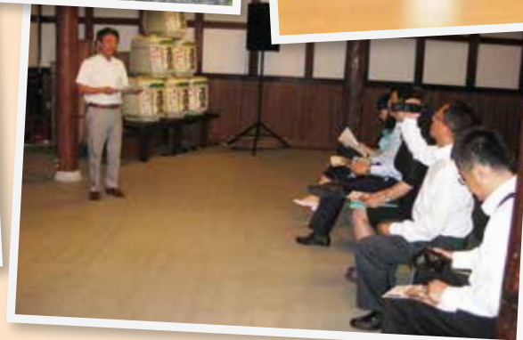
秋田酒類製造株式会社 「仙人蔵」訪問