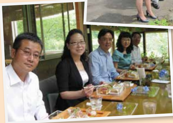
農家レストラン訪問