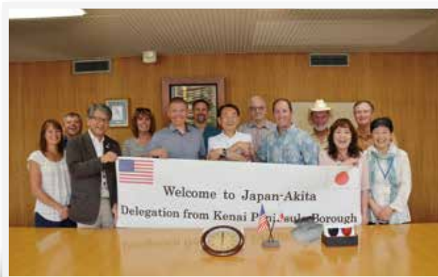
市長表敬時の記念撮影