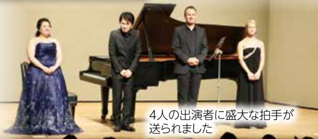
4人の出演者に盛大な拍手が送られました