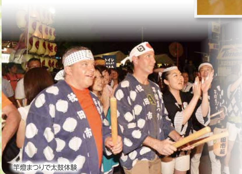
竿燈まつりで太鼓体験