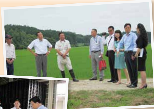
米の生産者を訪問