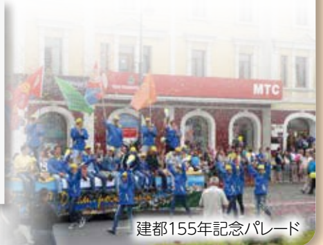
建都155年記念パレード