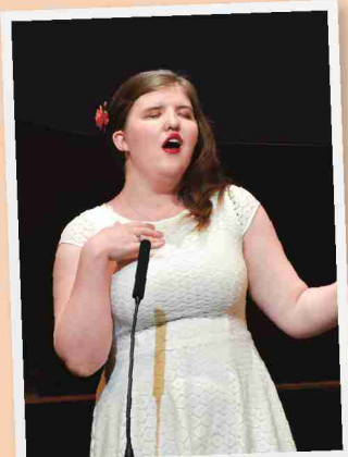
熱唱するブリタニーさん