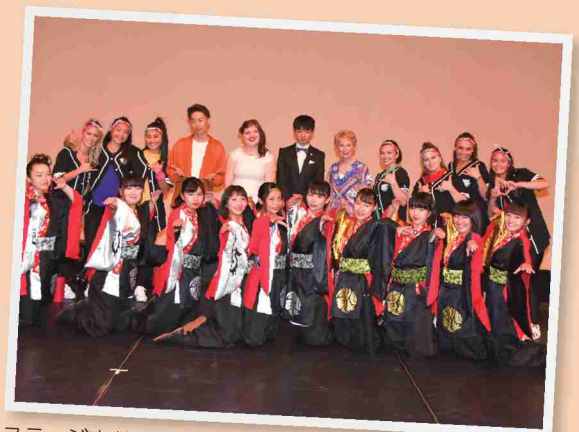
ステージ直前の出演者たち