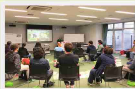
ビデオを見ながら、手順を確認

秋田市消防本部および城東消防署の職員3名が講師となり、動画ややさしい日本語を使って説明し、実際に心臓マッサージやAEDの使い方、模擬119番システムを使用した通報の練習を行いました。