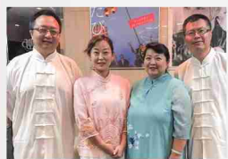
蘭州市研修員のみなさん