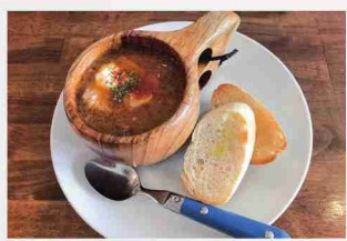
ほろほろビーフのボルシチ