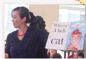
そら子ママ英語サークル

秋田市で大人気の「そら子ママ英語サークル」が楽しく英語で絵本の読み聞かせをします!親子そろってご参加ください。(対象年齢:0才から小学校低学年まで)