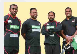
ノーザンブレッツ選手もやってくる!