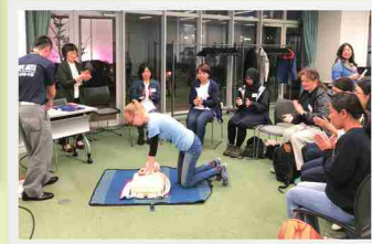
3つのグループに分かれて、心臓マッサージとAEDの使い方を体験