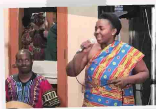
アフリカ・チーム