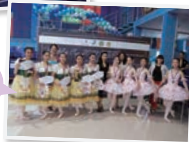
演技終了後、 カップとメダルと 共に記念撮影