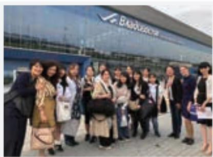
ウラジオストク市のみなさんが 空港でお出迎え