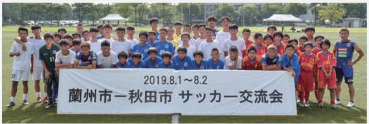
ブラウブリッツ秋田のプロ選手によるサッカー教室を終えて記念撮影