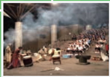
なまはげ太鼓で歓迎!