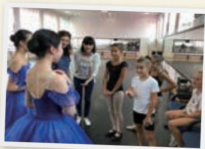
ホームステイ先の子もたちとの対面