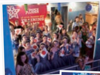
フレンドシップカップ 2019オープニング