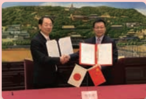
新友好交流合意書(2020～2022年度)の締結

また、蘭州市医療研修生の所属病院の一つである「蘭州市第二人民医院」を視察し、院長および元研修生の医師等から研修への感謝の言葉が述べられました。