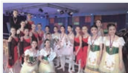
共演したドゥビーニンの生徒たちと一緒に