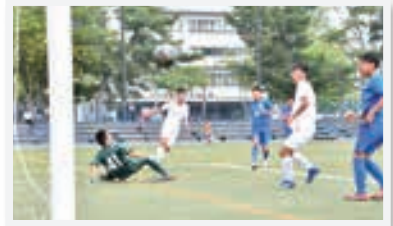
交流試合での激しい攻防！