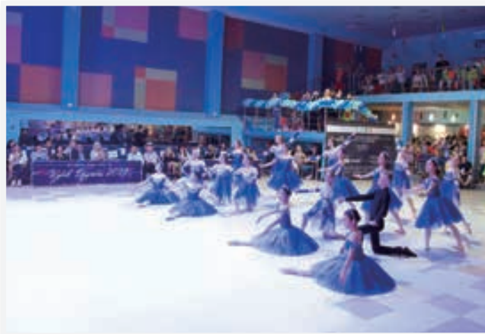
フレンドシップカップ2019本番での合同演目披露

今回の訪問では、現地の生徒との合同演目披露という共通の目的をもった練習ができたことで、単なる学校訪問では味わうことのできない実りのある交流となり、将来の交流継続にもつながる有意義な訪問となりました。