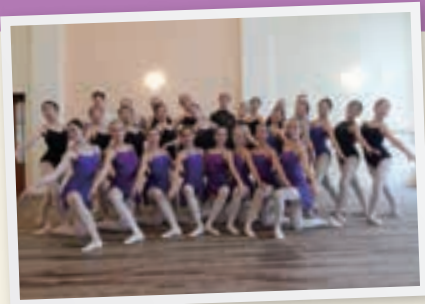
Children's Art School No.6 バレエスタジオを訪問