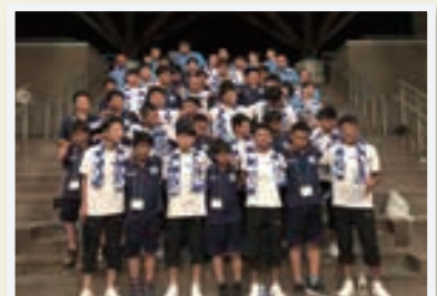
まんたらめでの交流会