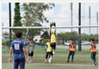
サッカー教室では、プロ選手の技術とスピードに感動する選手たち