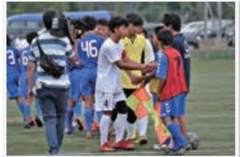
試合後には、両市の選手が仲良く握手を交わす