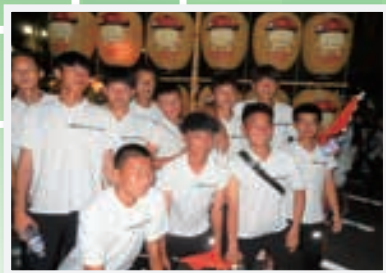
竿燈まつりに大興奮!