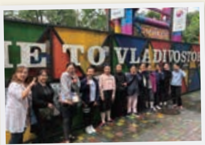
ウラジオストク市内を散策