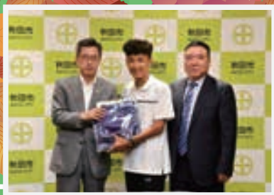
市役所表敬の様子