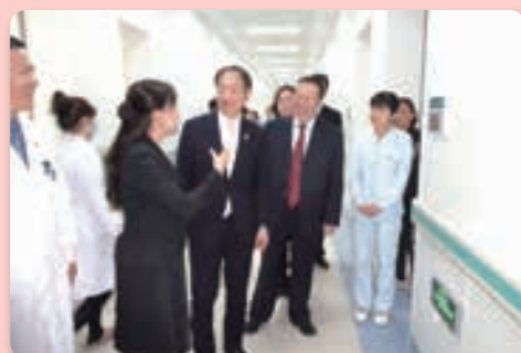
蘭州市第二人民医院視察