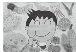
令和3年度入賞作品

10月の市民健康づくり月間に合わせて、「元気もりもり子ども絵画」を募集します。「野菜も果物ももりもり食べよう」などのテーマで、八つ切り画用紙に描いてください。入賞者には記念品を贈呈します。詳しくは、小・中学校にお知らせしているほか、市ホームページをご覧ください。