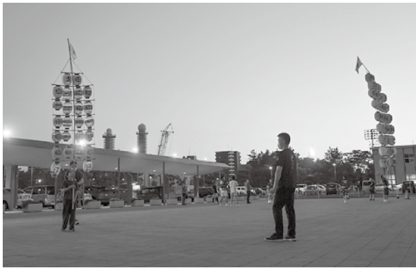
竿燈まつりに向けて練習中 (市役所前にて)