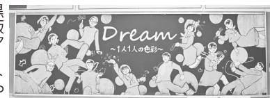
黒板アートや思い出の写真が飾られた教室

そして、全校生徒による「下浜讃歌」の合唱に続き、秋田市への校旗返納が行われました。