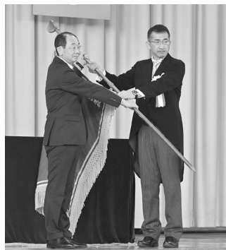
校旗が秋田市に返納されました