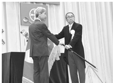
校旗が秋田市に返納されました