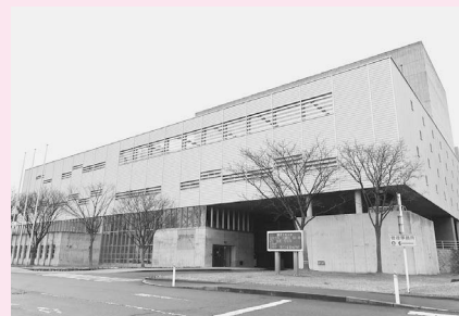
総合環境センター

この手数料と同額の「手数料相当額」は、条例で使い道が定められており、ごみ減量やさまざまな環境対策に活用することになっています。次の世代の負担を減らし、私たちの美しい環境を未来に引き継ぐため、今後ともご協力をお願いします。