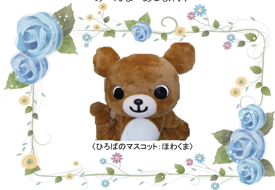
〈ひろばのマスコット:ほわくま〉

あかちゃん げんきなおともたち パパやママ おじいちゃんおばあちゃん みーんな あつまれ!