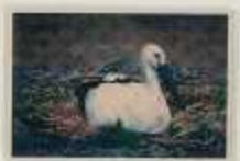
たまごもあたためていぼす!