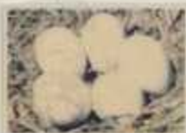
たまごのあたまは、はわりが大きい!!