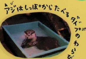
アジはしほからたべる。タイフのからびる。