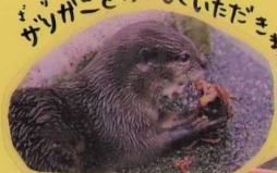
ザリガニをおいしくいただきます。