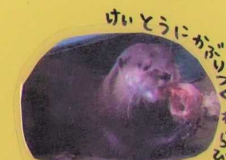
けいとうにからびる。