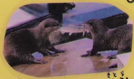
川魚のつなみき中の村とたまご