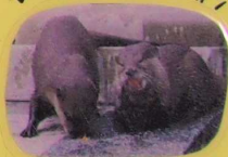
しいいとすきなキンカン