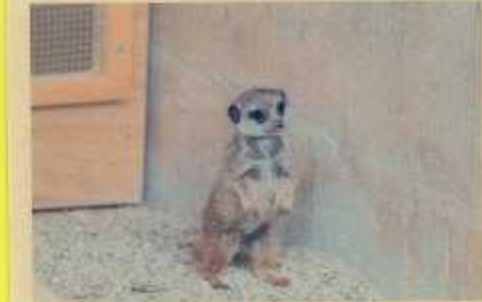
見らんがんこ いこね!