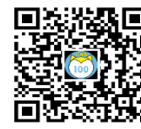
南大通り・中通病院前