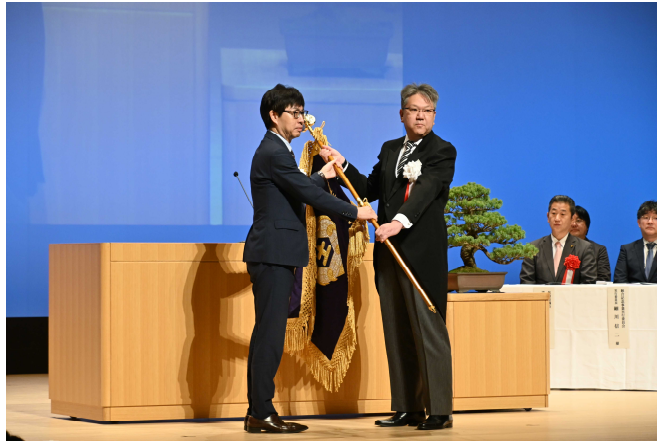
秋田市長から、新たな土崎小学校の校旗が授与されました。