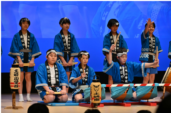
両校児童による土崎港ばやし、地域の協力のもと、盛大に披露されました。