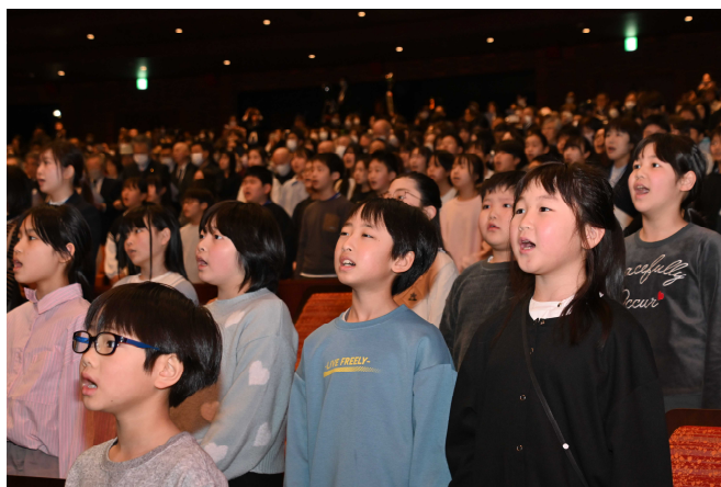
式典の最後には、会場の全員で心をひとつに、新校歌を斉唱しました。