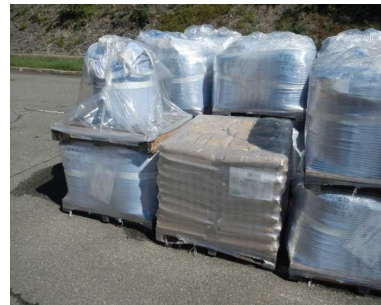
写真 品質保証期限切れの耐火物