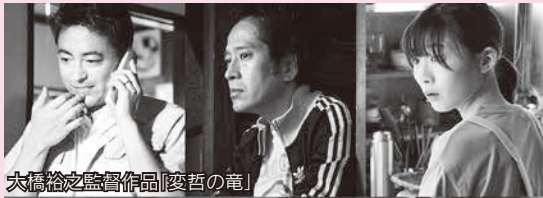
大橋裕之監督作品「変哲の竜」