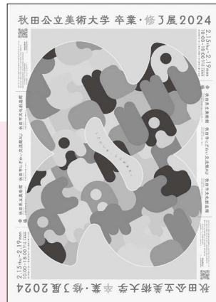
卒業・修了展ポスター