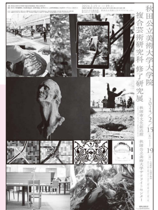
修了研究展ポスター