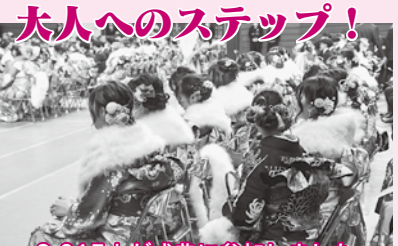
2,015人が式典に参加しました