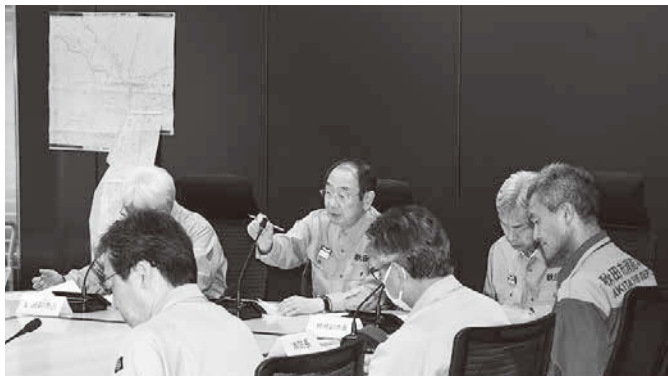
能登半島地震をふまえ、災害時の対応を再度検証・検討するよう指示しました(写真は7月豪雨災害の本部会議)