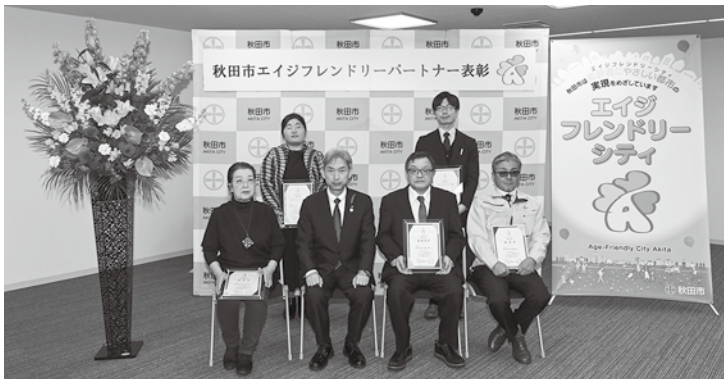
12月26日の表彰式に参加されたみなさん

「エイジフレンドリーパートナー」は、エイジフレンドリーシティ(高齢者にやさしい都市)の実現に向けて、民間の立場から取り組みを推進する事業者・団体などを登録する制度です。このたび、優れた取り組みを行っている同パートナーの表彰を、市役所で行いました。受賞された事業者は次のとおりです。おめでとうございます。問▶長寿福祉課 ☎(888)56966