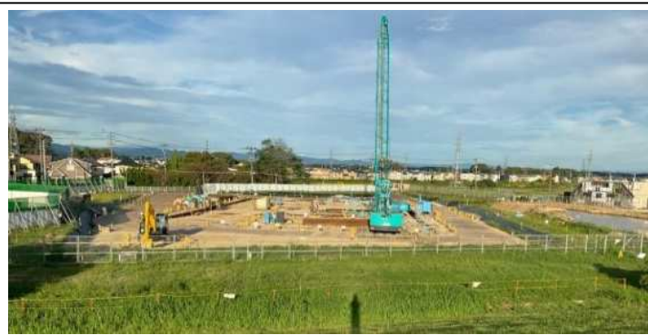
ポンプ場全景(土留工事)