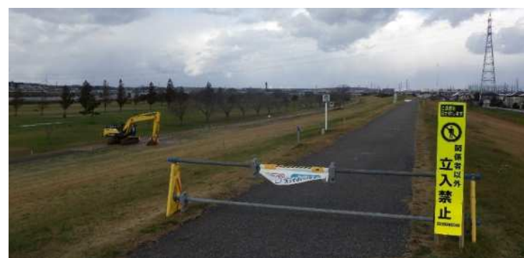
乗り越し管 工事用道路全景(ポンプ場西側)