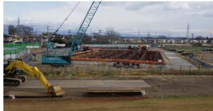
ポンプ場全景(二次掘削)