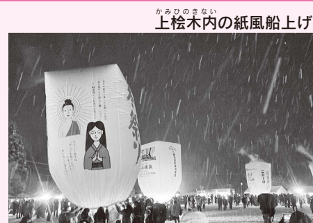
かみひのきない 上桧木内の紙風船上げ

灯火をつけた巨大な紙風船が、夜空に高く舞い上がる冬の風物詩◆(毎年2月10日に開催)