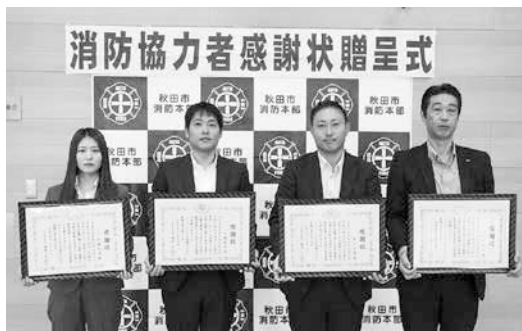
11月16日の感謝状贈呈式