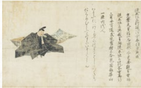
重要文化財「佐竹本三十六歌仙絵 平兼盛」 詞 伝後京極良経筆、絵 伝藤原信実筆 鎌倉時代(13世紀) MOA美術館蔵【中期展示】