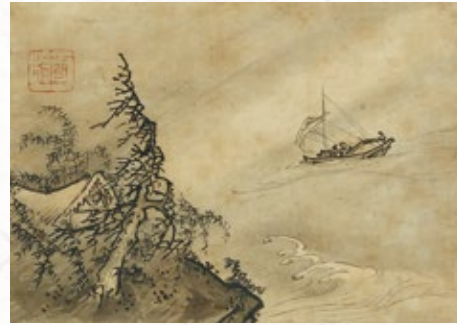
重要文化財 雪村周継「風濤図」 室町時代(16世紀) 野村美術館蔵【中期展示】