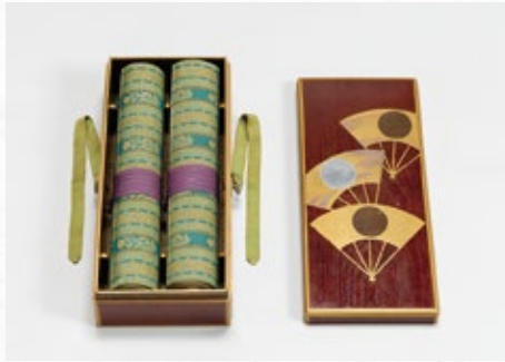
「月丸扇紋蒔絵巻物箱」 江戸時代(18-19世紀) 個人蔵【通期展示】

本展では、絵巻切断から100余年、過去最多15幅が秋田へと里帰りし、順次展示替えをしながらご紹介いたします。さらに、絵巻の各種模本を同時に展示し、近世における佐竹本三十六歌仙絵の図像の伝播についても考えます。この他にも当館所蔵の秋田蘭画や佐竹家ゆかりの作品・資料も含めた約60件を間近でご覧いただき、時代を超えて愛される名品の魅力をご堪能ください。