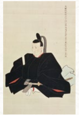
秋田県指定有形文化財 狩野秀水「佐竹義和像」 江戸時代(19世紀) 天徳寺蔵 【通期展示】