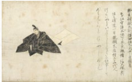
重要文化財「佐竹本三十六歌仙絵 大中臣頼基」 詞 伝後京極良経筆、絵 伝藤原信実筆 鎌倉時代(13世紀) 遠山記念館蔵【中期展示】