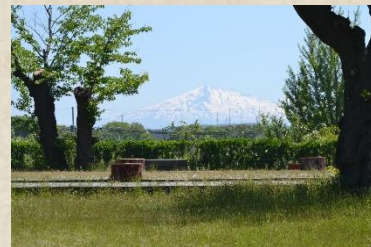
プロジェクトの一例 鳥海山への眺望の復活

お申込みはインターネットが便利！（ふるさとチョイスガバメントクラウドファンディングへ）