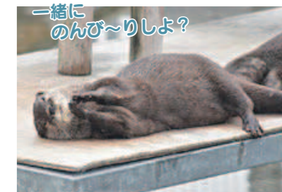
一緒にのんびりしよ?