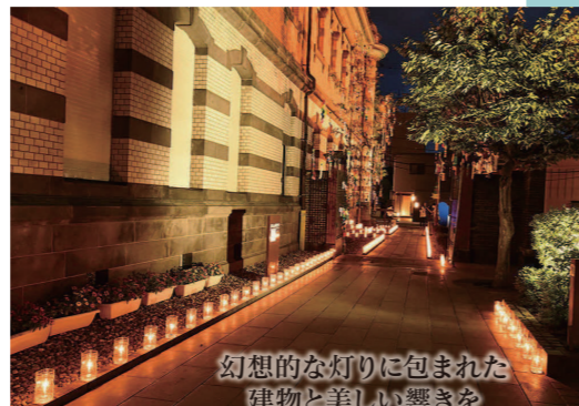
幻想的な灯りに包まれた 建物と美しい響きを お楽しみください♪