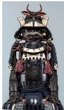
細糸素懸威二枚胴具足(佐竹義処所用)

雄大な歴史を積み重ねてきた佐竹家。その歴史と文化を物語る書状類や甲冑、豪華な調度品などを紹介します。