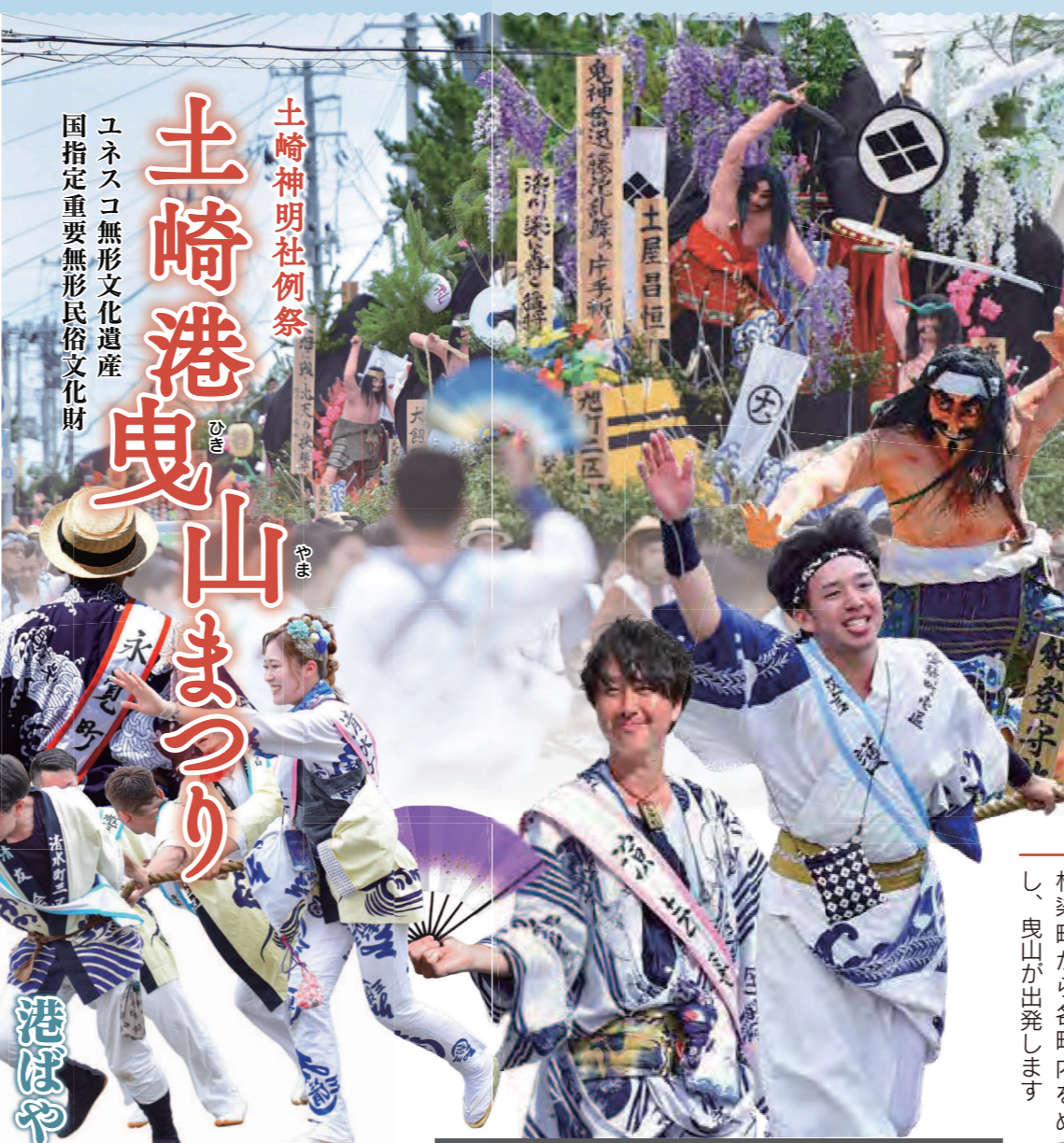
問 土崎港祭り実行委員会 ☎(845)2264